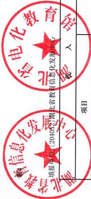
财政拨款收支汇总表